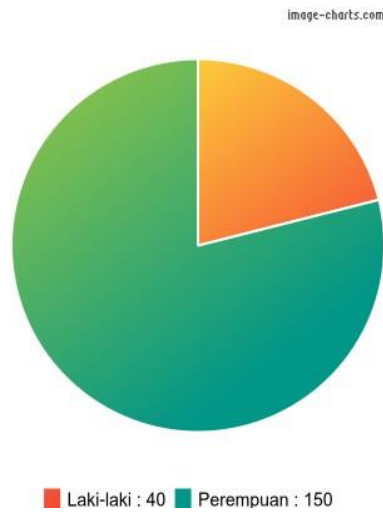
Gambar 1. Profil Kelompok Jenis Kelamin Responden